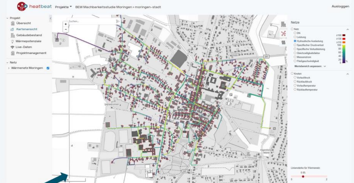
Screenshot des digital Zwillings für Moringen